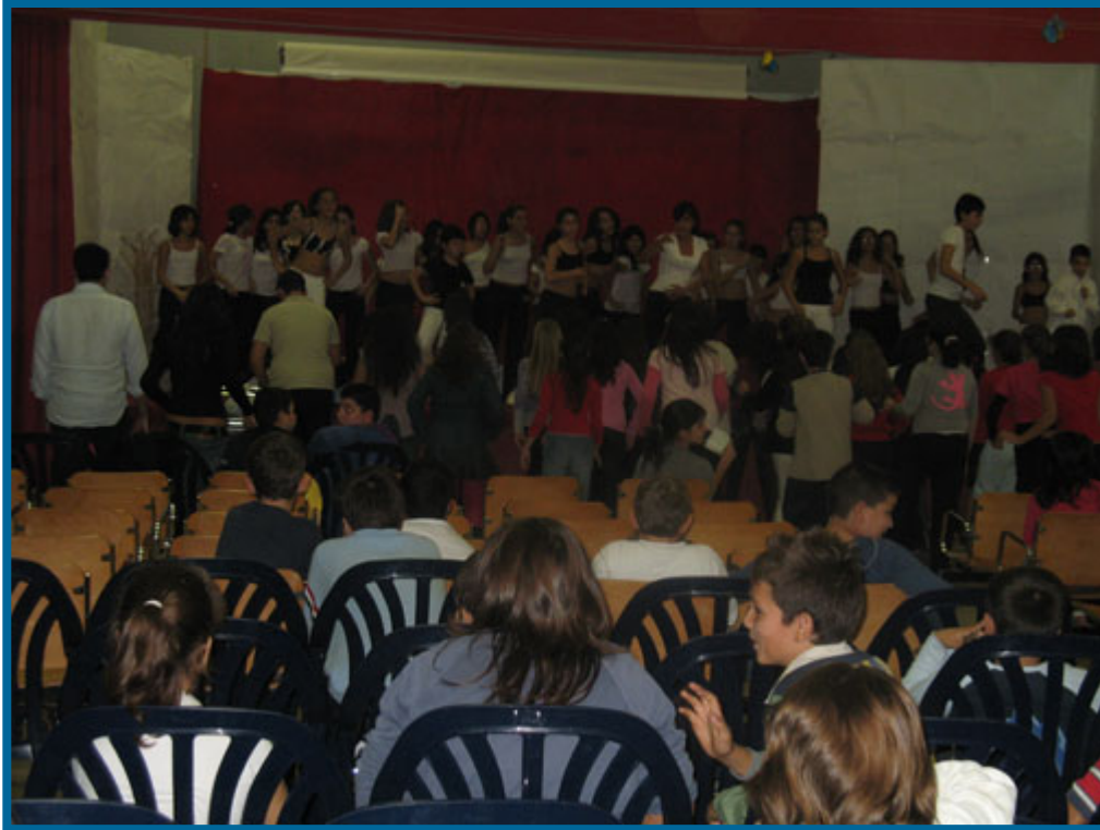
Tutti insieme allegramente