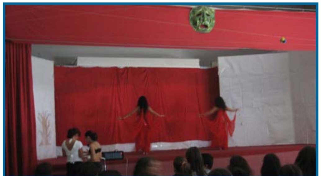
Le coreografie della scuola di ballo