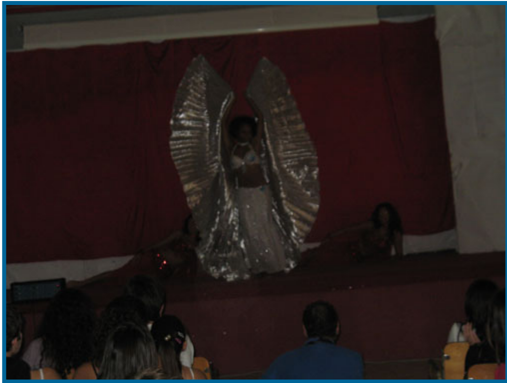
Le fasi dello spettacolo