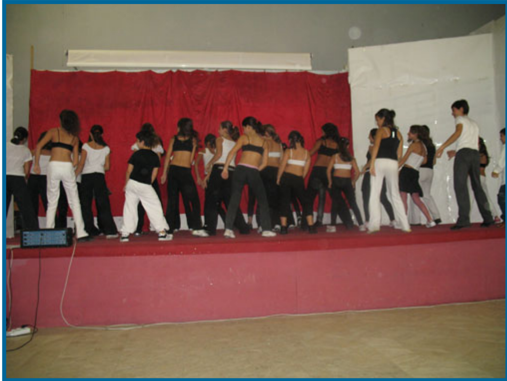
Gli alunni dell'Istituto