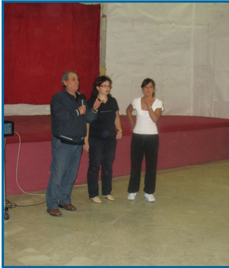
I saluti del Dirigente Scolastico Inizia la manifestazione